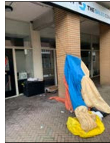
Laat niet als dank voor 't nachtelijke verpozen in de binnenstad je tent, je troep en alle Pizzadozen.