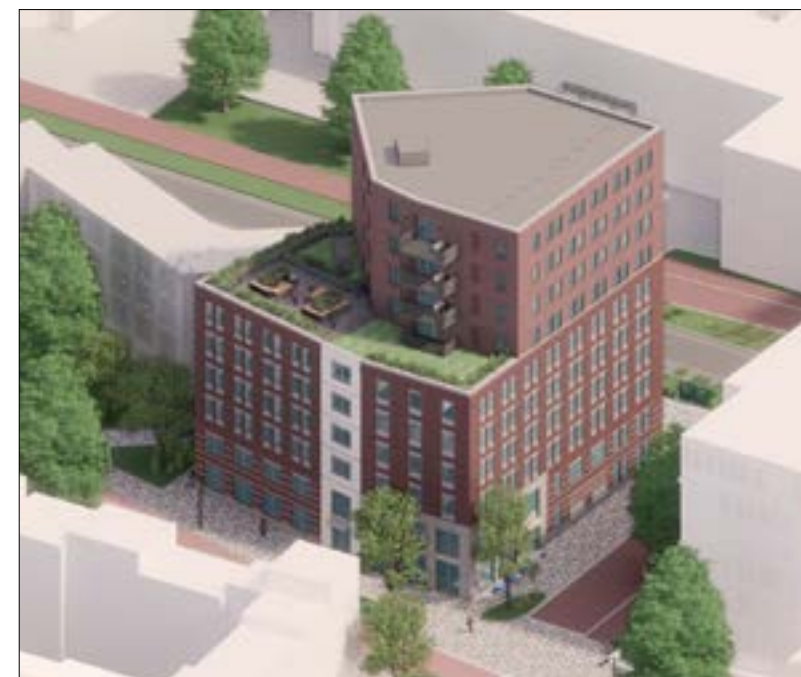
99 appartementen voor jongeren op de hoek van de Wenninkgaarde-Molenstraat.

Het ontwerp van het gebouw waarmee wordt gestart, is wat betreft stijl en sfeer een voorbeeld voor de bouwvolumes die nog zullen volgen. Het ontwerp is een moderne vertaling van een pakhuis uit het rijke textielverleden van Enschede en het monumentale Van Heekcomplex aan de andere kant van de spoorlijn. Een opbouw van meerdere lagen