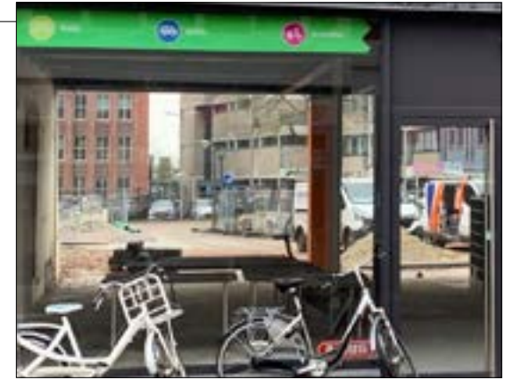
Doorzonwinkel met zicht op binnenterrein waar 36 lofts voor young professionals worden gebouwd.